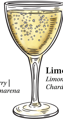
Limoncello Spritz Limoncello | Chardonnay gaseificado