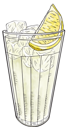
Vodka Collins R$42

• SEGUNDA A SEXTA, DAS 15H ÀS 17H30 = R$29 •