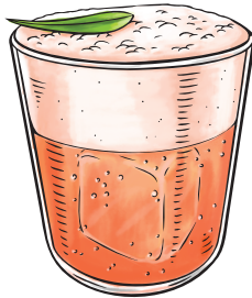
Cosmonik Vodka | Aperol | chardonnay gaseificado | cranberry | laranja | espuma de gengibre e amarela