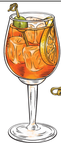
Aperol Spritz R$42