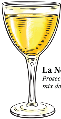
La Nostra Mimosa Prosecco | bitter | mix de laranjas Bahia e Pera