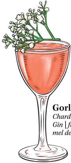
Gorlami Chardonnay gaseificado | Gin | framboesa | mel de cacau fresco | cítricos